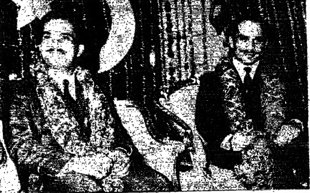
مشهدان من وصول واستقبال جلالة الحسين وسمو الامير حسن لدى وصولهما الى كراتشي القطنها « على التوالي »

شاهدنا عقد القران وقد وقع الحسين والمشير ايوب خان عقد الزواج تكاملا . ولم تجلس الاميرة نورة مع الامير حسن عندما اخذ قاضي الشرع مولانا جمال الدين عقد قرانها . وقد تست موانعة الاميرة على عقد القران بواسطة وكيل عنها . وبعد ان وقع الحزب عقد الزواج بخل القبل لجلالة الاميرة نورة وقد رافقه البقية على الصفحة السادسة عمود ٢